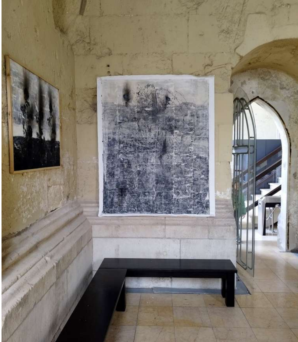
RONGYOK, VIRÁGOK MÁRIA MAGDOLNA TORONY 2023