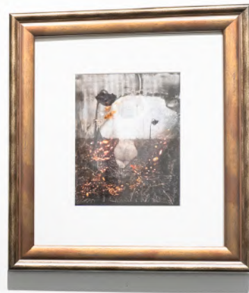
TRAUMA MAGYAR MŰHELY GALÉRIA 2021