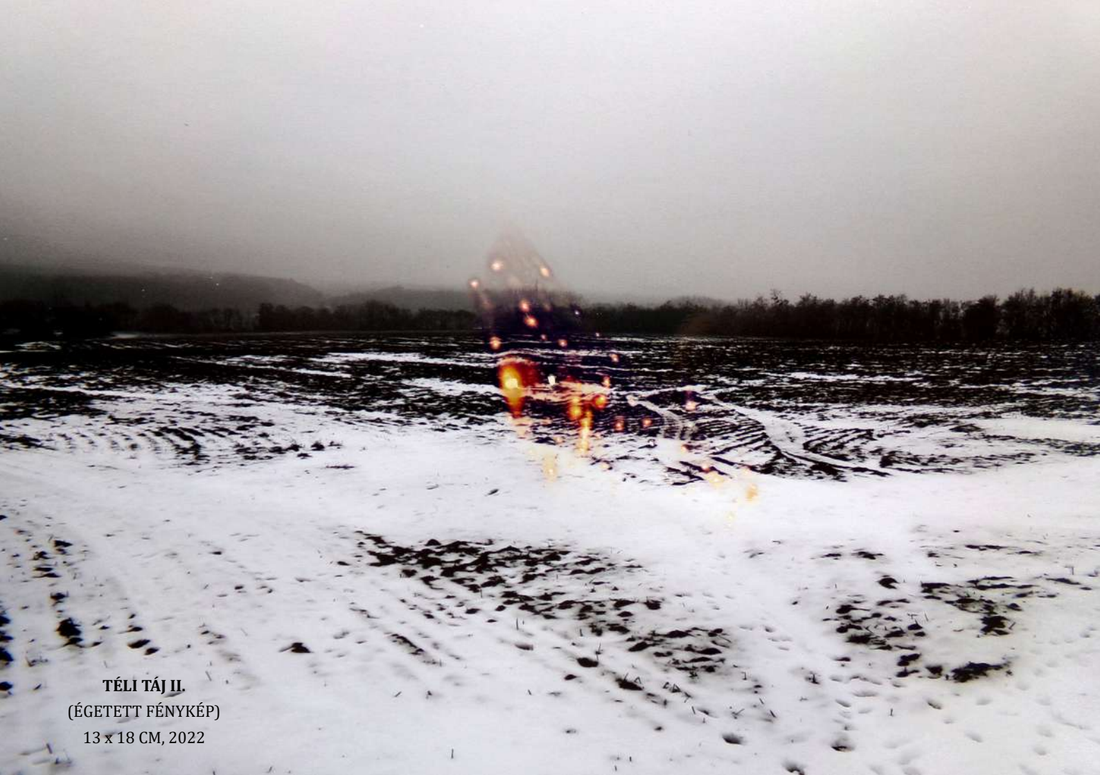
TÉLI TÁJ II. (ÉGETETT FÉNYKÉP) 13 x 18 CM, 2022