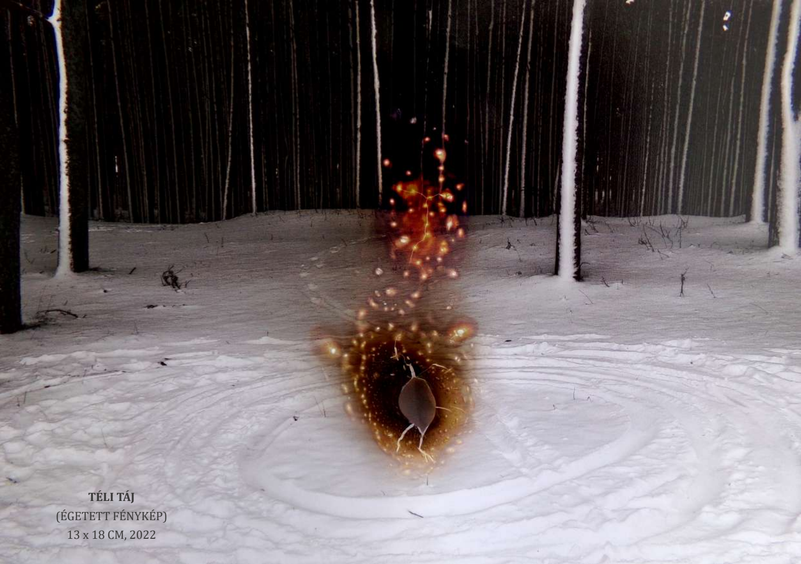
TÉLI TÁJ (ÉGETETT FÉNYKÉP) 13 x 18 CM, 2022