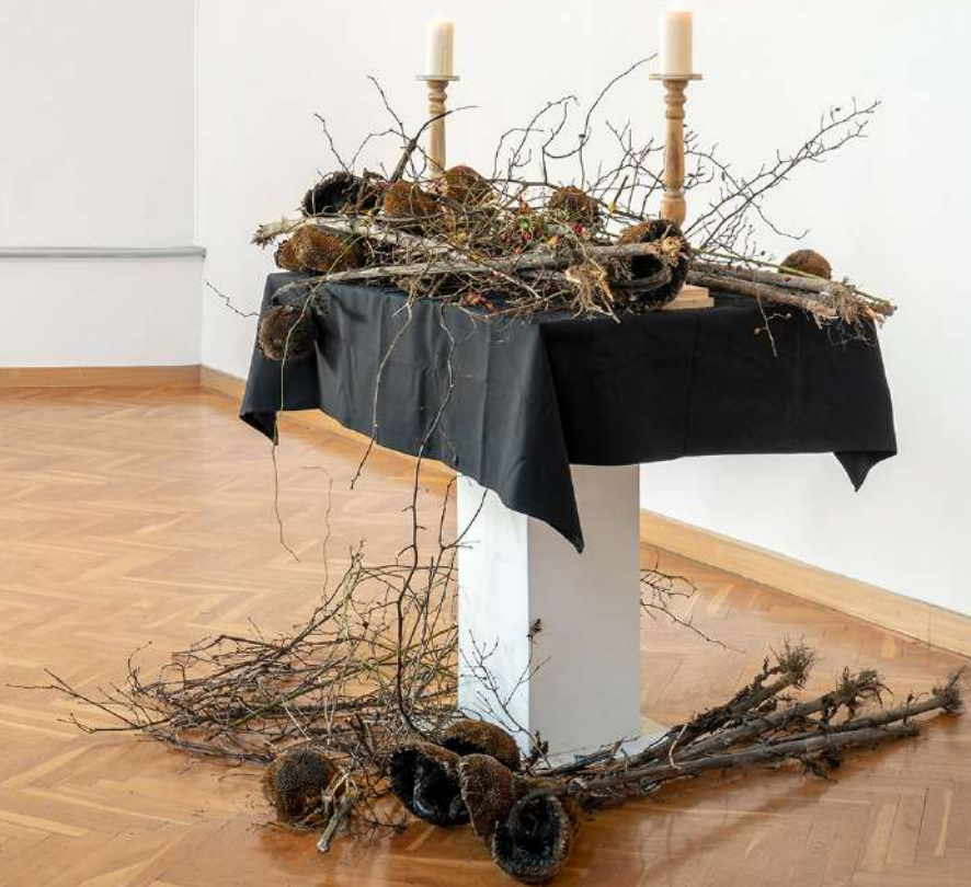
SACRIFICATIO GAÁL IMRE GALÉRIA 2021