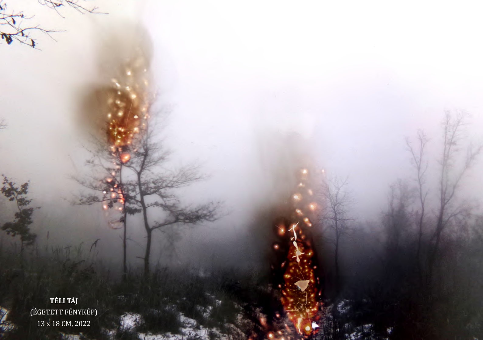
TÉLI TÁJ (ÉGETETT FÉNYKÉP) 13 x 18 CM, 2022