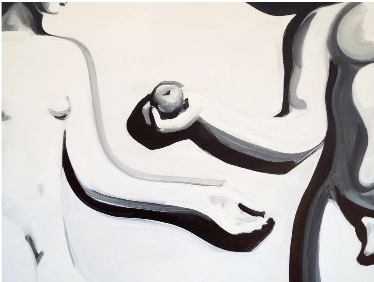
ÉTELOSZTÁS (IPARI FESTÉK, VÁSZON) 180 X 180 CM, 2015