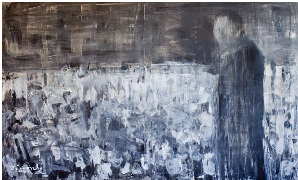
TÖMEG ÉS BESZÉLŐ (FESTÉK, VÁSZON) 120 X 180 CM, 2016