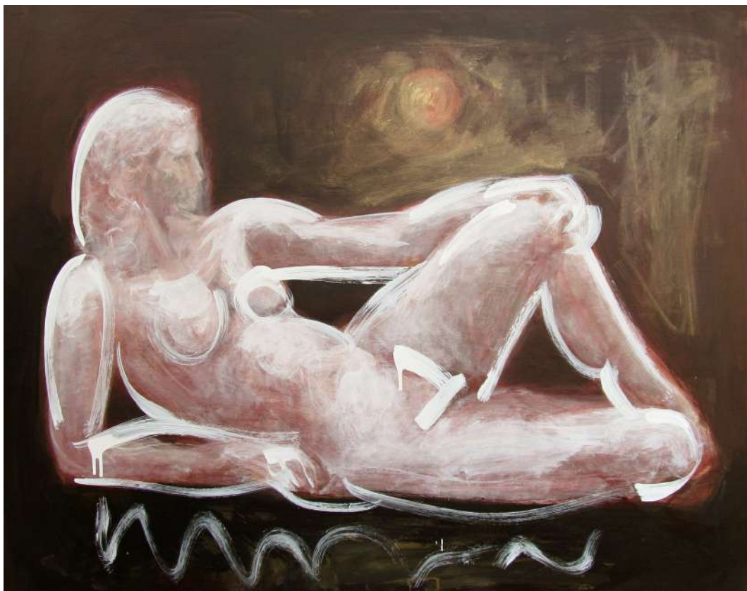
AKT (IPARI FESTÉK, VÁSZON) 150 X 120 CM, 2015