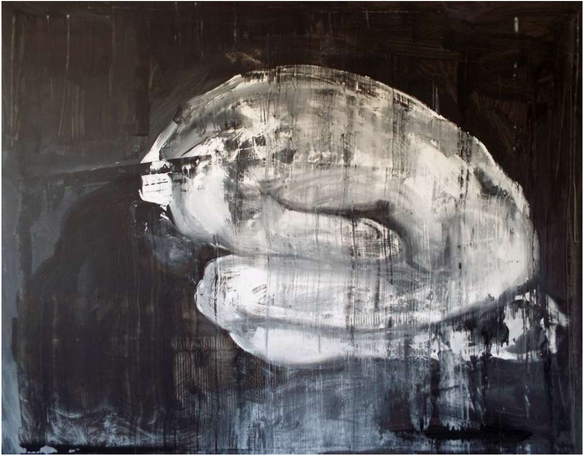
KUPORGÓ AKT (IPARI FESTÉK, VÁSZON) 150 X 190 CM, 2015