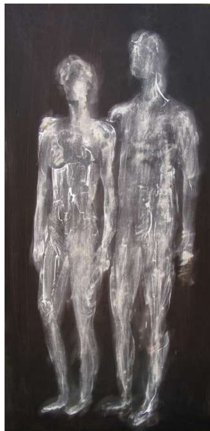
HŐS FÁKLYÁVAL | PÁR (IPARI FESTÉK, FA) 120 X 60 CM, 2015