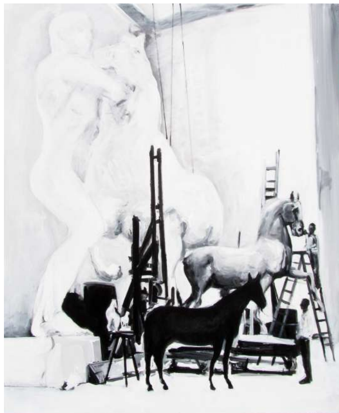
SZOBRÁSZ | MŰTEREM (FESTÉK, VÁSZON) 180 X 150 CM, 2015