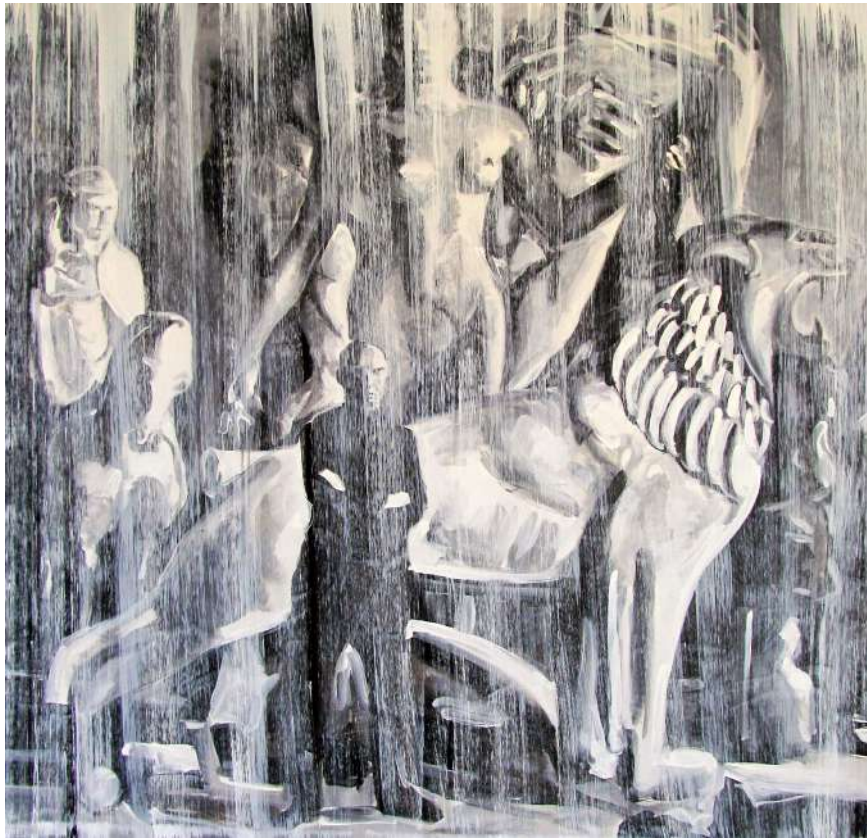
SZOBRÁSZ (IPARI FESTÉK, VÁSZNON) 150 X 150 CM, 2015