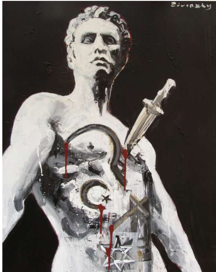
IDEÁK VAGY AMIT AKARTOK (IPARI FESTÉK, VÁSZN) 150 X 120 CM, 2015