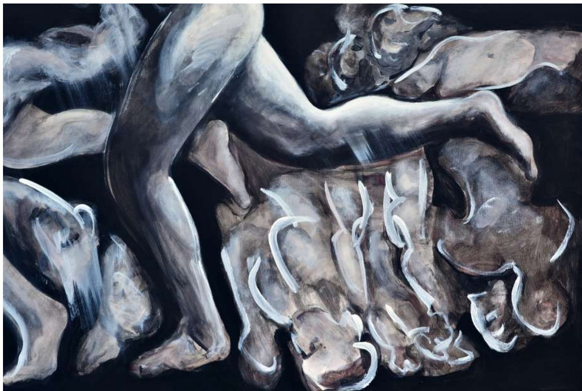
FUTÁS (IPARI FESTÉK, VÁSZN) 150 X 190 CM, 2015