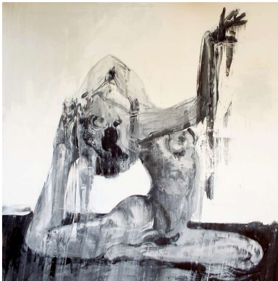
SZABADTESTKULTÚRA (IPARI FESTÉK, VÁSZON) 150 X 150 CM, 2015