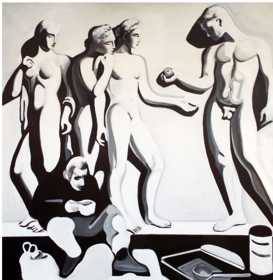
ÉTELOSZTÁS (IPARI FESTÉK, VÁSZON) 180 X 180 CM, 2015