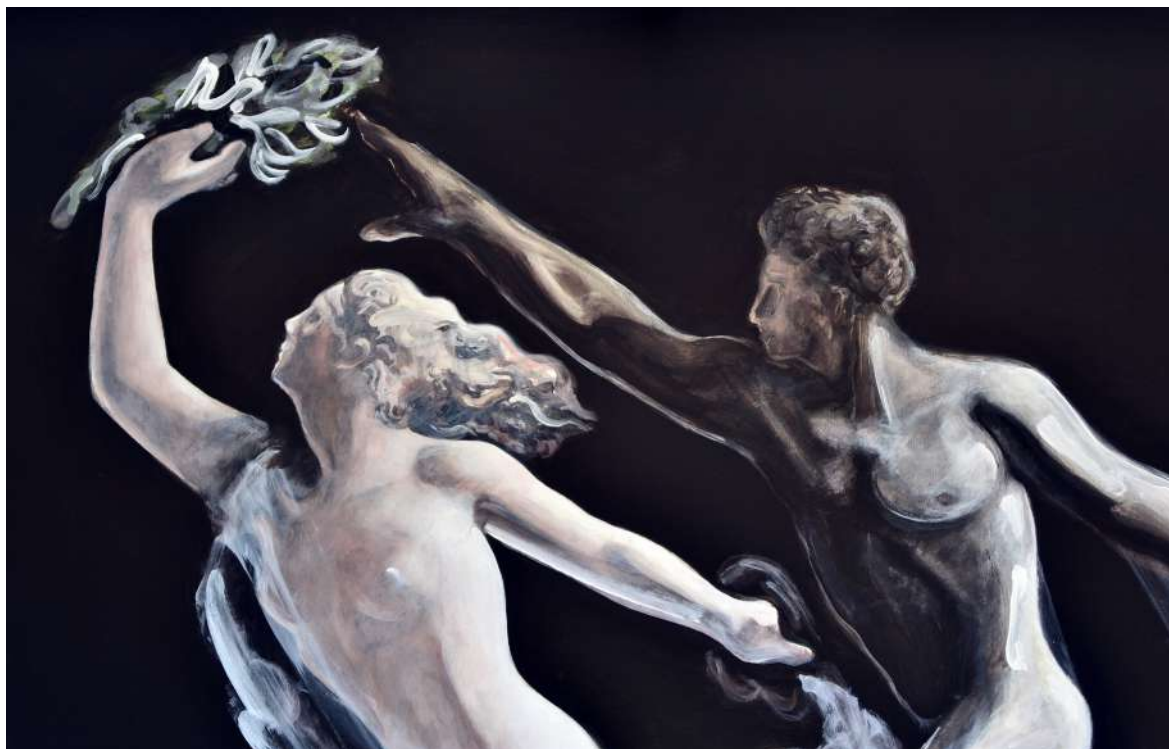
FUTÁS (IPARI FESTÉK, VÁSZNON) 150 X 190 CM, 2015