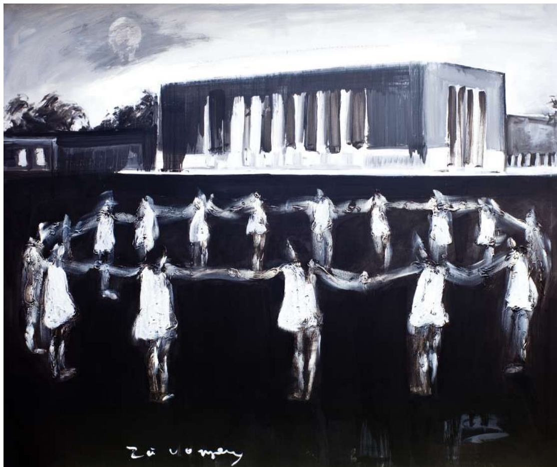
KÖRTÁNC (IPARI FESTÉK, VÁSZNON) 150 X 180 CM, 2015