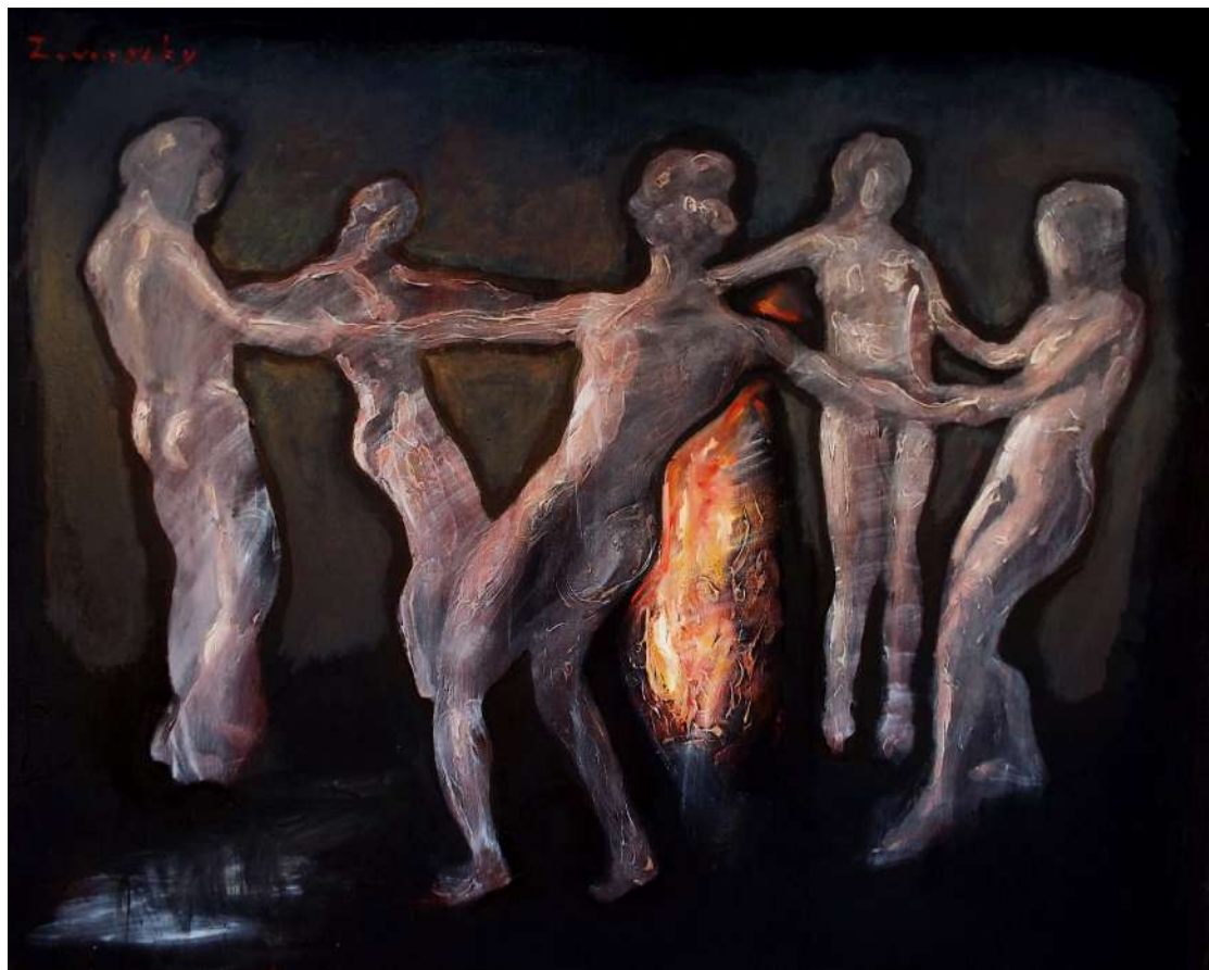
TŰZTÁNC (IPARI FESTÉK, OLAJ, VÁSZON) 120 X 150 CM, 2015