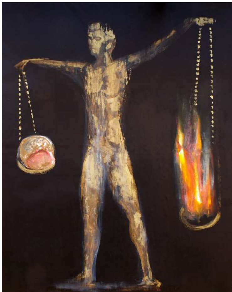
MÉRLEG (IPARI FESTÉK, VÁSZON) 150 X 120 CM, 2015