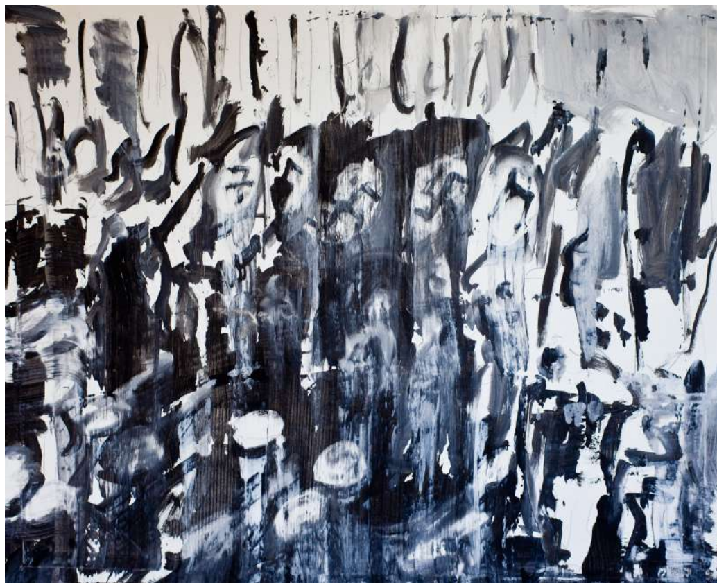
FELVONULÁS (IPARI FESTÉK, VÁSZON) 90 X 110 CM, 2016