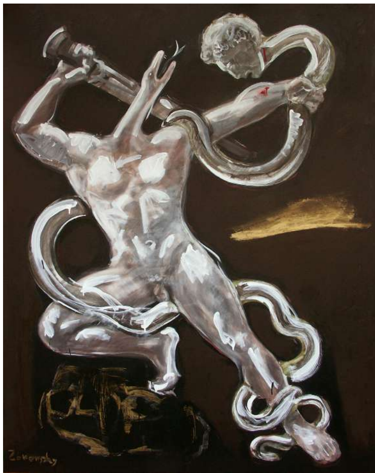
KÉPMUTATÁS (IPARI FESTÉK, VÁSZN) 190 X 150 CM, 2015