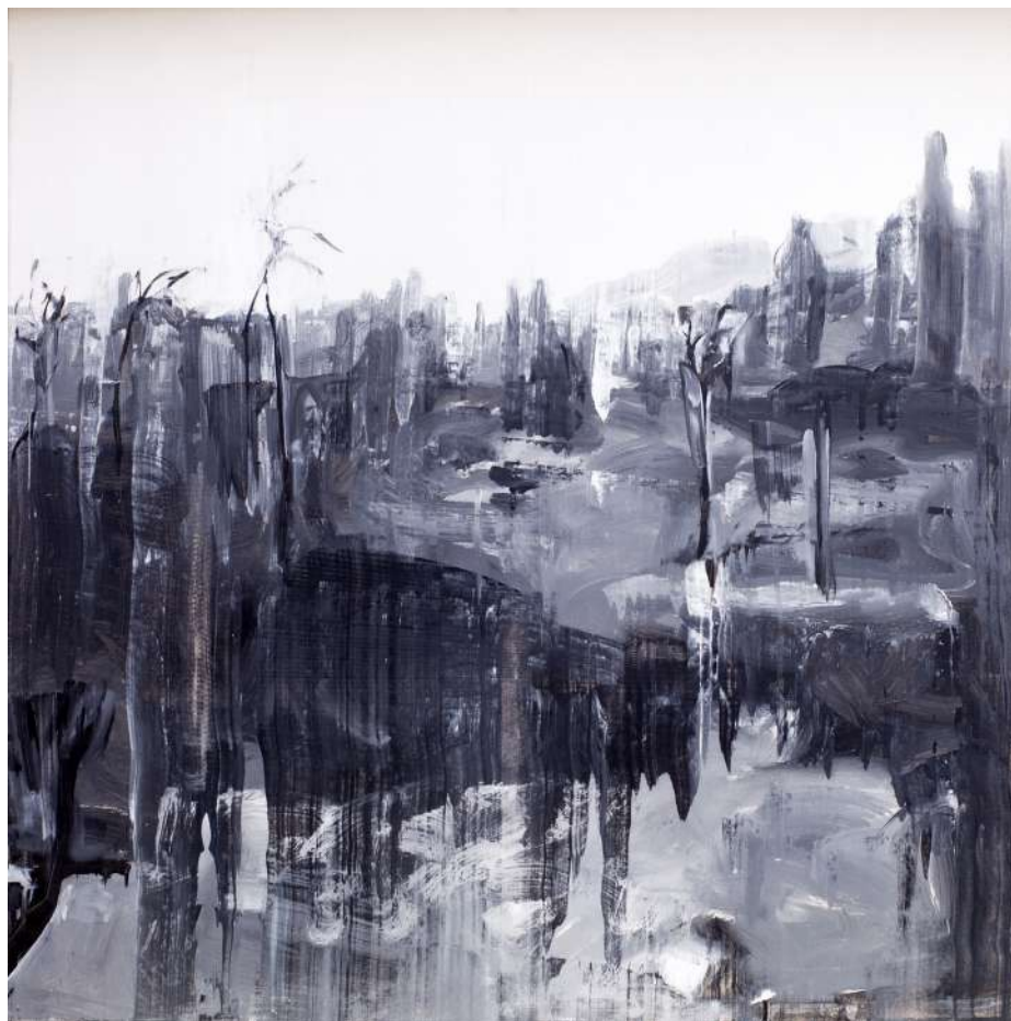
HÁBORÚ UTÁN (IPARI FESTÉK, VÁSZON) 150 X 150 CM, 2015