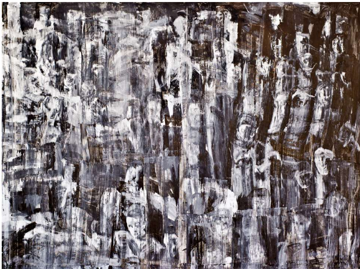
TÖMEG (IPARI FESTÉK, VÁSZON) 150 X 200 CM, 2016