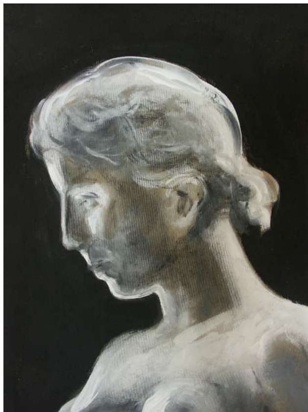
AKT (IPARI FESTÉK, VÁSZN) 160 X 85 CM, 2015